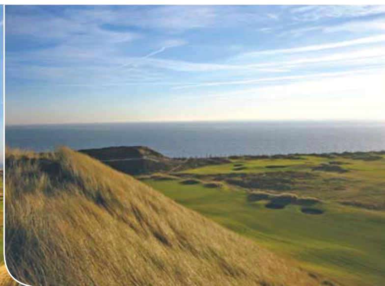
Hål 14 och 15 från toppen av en sanddyn.