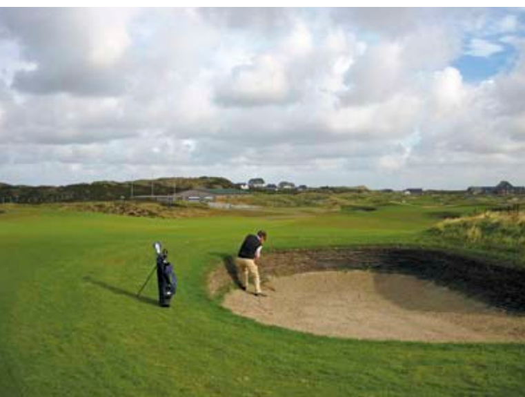
Artikelförfattaren slår sig ur en av bunkrarna på håll två. Jo, det blev en bogey...

Håll 13 är ett par trehål med en delvis blind greenyta medan håll 14 är ett långt par fyra, där man spelar längs med en av områdets majestätiska naturliga sanddyner. Håll 15 är bara 100 meter men innehåller all den dramatik som ett vindutsatt golvhåll på en linksbana kan ha. Närheten till