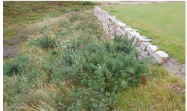
Gorsebuskar har planterats runt om på banan, här vid sidan om 15:e utslaget.

Efter andra världskrigets slut etablerades en engelsk flygbas på ön och redan i början på 1950- talet bildades The Royal